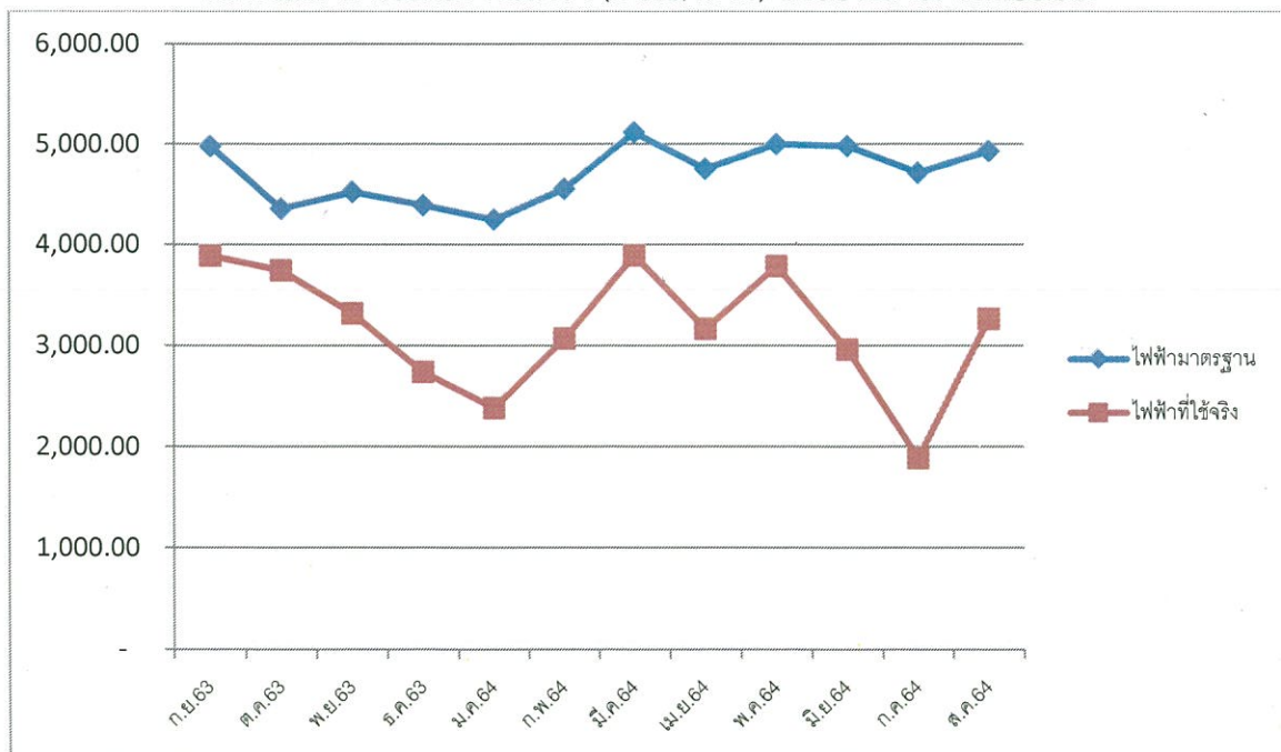
กราฟแสดงการใช้พลังงานไฟฟ้า (หน่วย/kWh) ปีงบประมาณ พ.ศ.๒๕๖๔