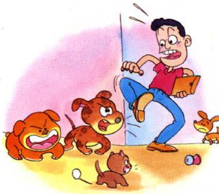
จะป้องกันโรคพิษสุนัขบ้าอย่างไร

รีบไปหาแพทย์หรือสัตวแพทย์ทันทีที่ถูกกัด เพื่อขอคำแนะนำเกี่ยวกับการฉีดวัคซีนและซีรัม อีอาร์จนสัตว์ที่กัดตายเมื่อสัตว์ตายรีบตัดหัวส่งตรวจ โรคพิษสุนัขบ้า