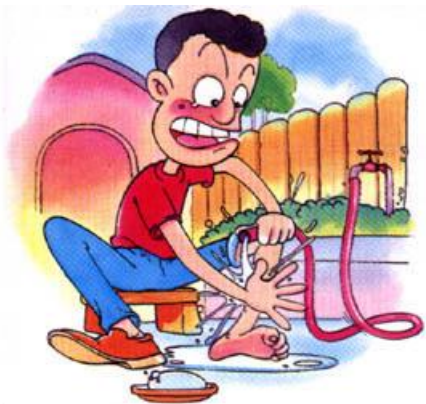
จะอย่างไรเมื่อถูกสัตว์กัด

เทศบาลตำบลคลองแสนแสบ ได้พิจารณาเห็นถึงความสำคัญของการรณรงค์การฉีดวัคซีนป้องกันโรคพิษสุนัขบ้า โดยจัดกิจกรรมประชาสัมพันธ์แนะนำเมื่อถูกสุนัขที่สงสัยว่าเป็นโรคพิษสุนัขบ้ากัด ดังนี้